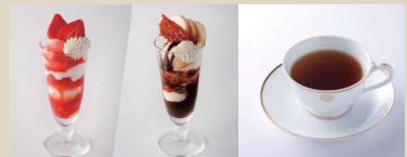
ミニパフェセット

本日のスープ/サラダ コーヒーまたは紅茶またはハーブティー プラス ¥ 1,430 (税込)