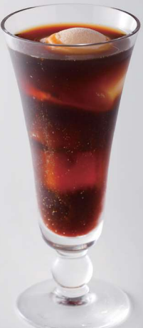
コーヒーフロート