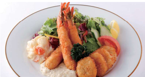
海老と帆立貝のフライ タルタルソース サラダ添え Fried Shrimp and Scallop with Tartar Sauce パンまたはライス付 with Bread or Rice ¥ 2,860 (税込) 🍴🍴🍴