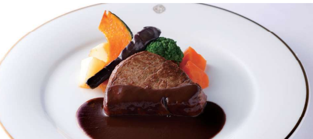
国産牛フィレ肉のステーキ または 国産牛フィレ肉のカツレツ デミグラスソース または 和風ソース Filet of Beef Steak パンまたはライス付 with Bread or Rice ¥ 4,950 (税込) ★