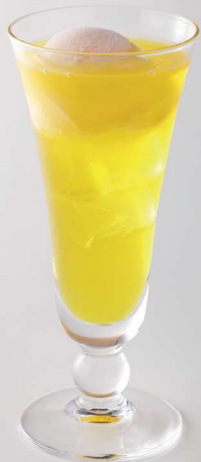
アイスクリームソーダ(レモン)