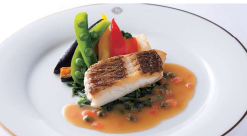
本日の魚料理 Today's Fish Dish パンまたはライス付 with Bread or Rice ¥ 2,860 (税込) ★