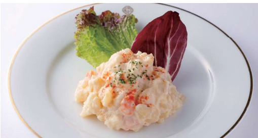
熟成北あかりのポテトサラダ Potato Salad ¥ 1,155 (税込) 🍴🍴