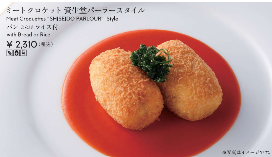
ミートクロケット 資生堂パーラースタイル Meat Croquettes "SHISEIDO PARLOUR" Style パンまたはライス付 with Bread or Rice ¥ 2,310 (税込) 🍴🍴