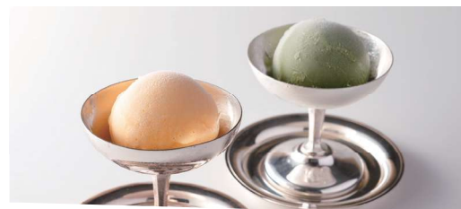
アイスクリーム(バニラまたは抹茶)/シャーベット

Ice Cream (Vanilla or Green Tea) / Sharbet