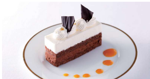
バニラとチョコレートのムース