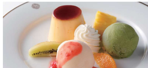
プリン・ア・ラ・モード