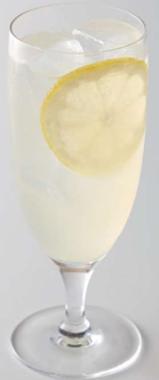
レモンスカッシュ