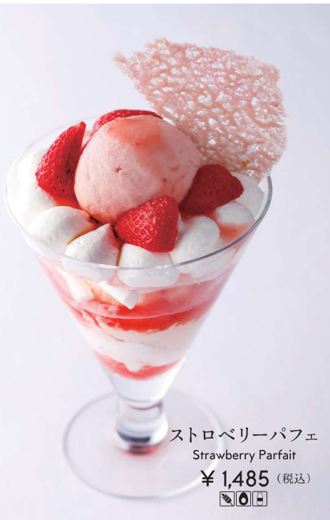
ストロベリーパフェ Strawberry Parfait