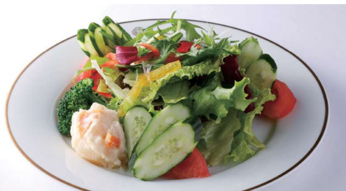
コンビネーションサラダ Combination Salad ¥ 1,320 (税込) ★

明治から昭和までの文士や文化人たちをとりこにし、うならせてきた資生堂パーラー伝統の味は脈々と歴代シェフたちに受け継がれています。