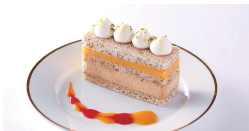
レモンとアールグレイのケーキ