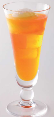
アイスクリームソーダ(オレンジ)