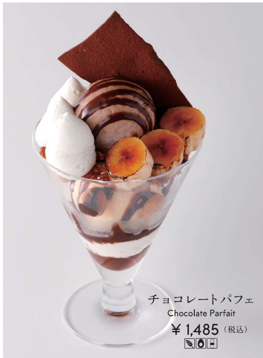
チョコレートパフェ Chocolate Parfait