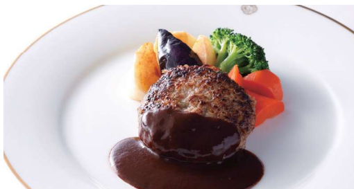
ハンバーグステーキ デミグラスソース または 和風ソース Hamburger Steak Demiglace Sauce or Japanese Sauce パンまたはライス付 with Bread or Rice ¥ 2,640 (税込) 🍴🍴