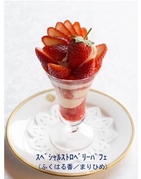
スペシャルストロベリーパフェ (ふくはる香/まりひめ)

和歌山県外ではなかなか味わえない希少な大粒の甘い苺を取り寄せました。心地よい香りが口いっぱいに広がります。