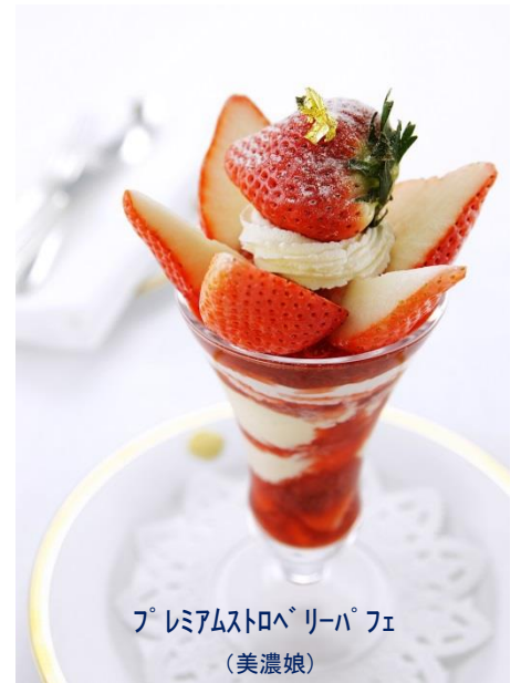
プレミアムストロベリーパフェ (美濃娘)

関東ではめったにお目にかかれない大粒の苺をアイスクリームまで使用しました。果肉が白く旨味と風味がとても良いです。