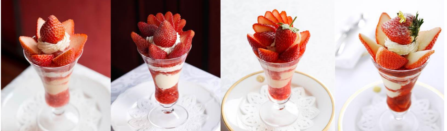
※写真左からストロベリーパフェ、スペシャルストロベリーパフェ(スカイベリー)、スペシャルストロベリーパフェ(ふくはる香/まりひめ)、プレミアムストロベリーパフェ(美濃娘)

1902年に資生堂調剤薬局の一角で、日本初のソーダ水とまだ珍しかったアイスクリームの製造販売から始まった資生堂パーラーは2017年に創業115周年を迎えます。みなさまとのいいご(115)縁に感謝し特別メニューや記念商品を企画。銀座本店 サロン・ド・カフェでは全国のおいしい苺の中から選りすぐりの15品種を一堂に集め、15種のストロベリーパフェをご用意する 2日間だけ の「 スペシャルストロベリーデー 」を開催いたします。大切に育てられた個性豊かな苺と、伝統のアイスクリームが織りなす、甘くて愛らしいパフェは、デコレーションだけでなくパフェの中の苺ソースもそれぞれの品種で仕立てます。個性豊かな美味しいストロベリーパフェをご堪能ください。