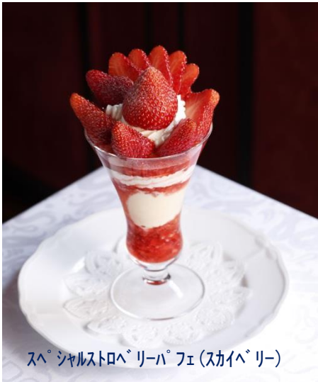
スペシャルストロベリーパフェ(スカイベリー)