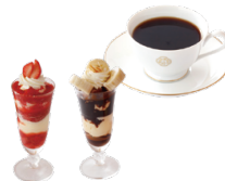
ミニストロベリーパフェまたは ミニチョコレートパフェ/ コーヒーまたは紅茶またはハーブティー

※当店の調理場ではえび・かに・小麦・卵・乳成分を使用したメニューを製造しております。 ※アレルギー物質については、スタッフにおたずねください。※表示価格は税込価格です。※写真はイメージです。