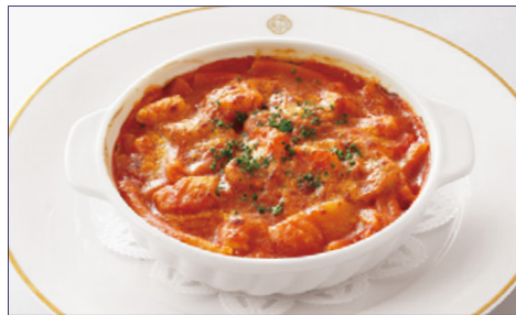
シーフードマカロニグラタントマトソース ¥2,070