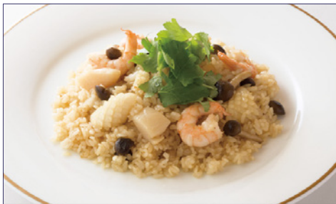
シーフード和風ピラフ ¥2,220