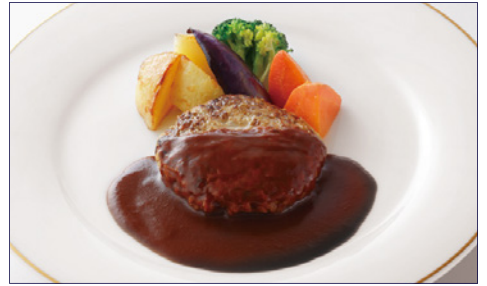
ハンバーグステーキ デミグラスソースまたは和風ソース パンまたはライス付 ¥2,580