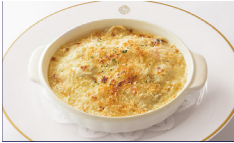
小海老とマッシュルームのドリア ¥2,180