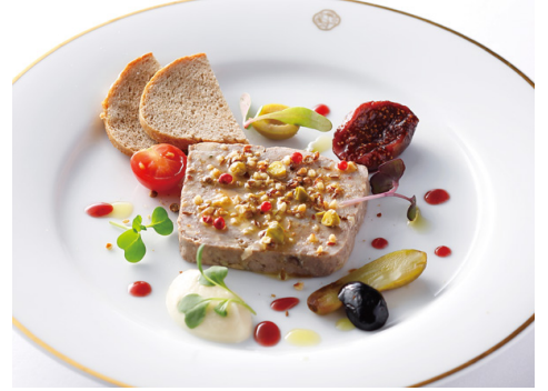
パテ・ド・カンパーニュ