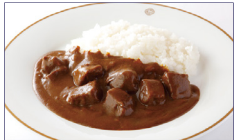
ビーフカレーライスまたはシーフードカレーライス ¥2,350