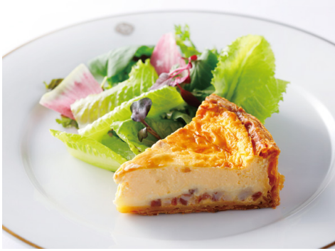
自由が丘店オリジナル ふわとろキッシュ ※数量限定