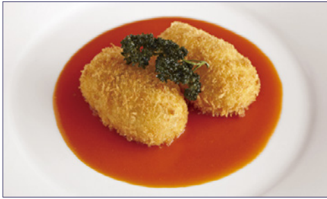
ミートクロケット 資生堂パーラースタイル パンまたはライス付 ¥2,220