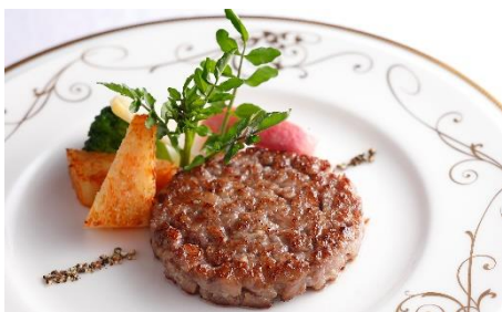
長野県産“信州プレミアム牛”のアッシュステーキ お好みのソースで

宮崎牛のきめ細やかな霜降りもたらすジューシーで柔らかな脂肪は、芳醇なコクがありながらもしつこくなく口の中で溶け出します。