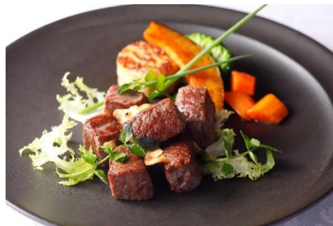
山口県産“まつなが和牛”フィレ肉のサイコロステーキ 塩だれソース

柔らかくきめ細やかな肉質と上品な旨味のある和牛肉を目指して生まれた“静岡そだち”。バルサミコソースでどうぞ。