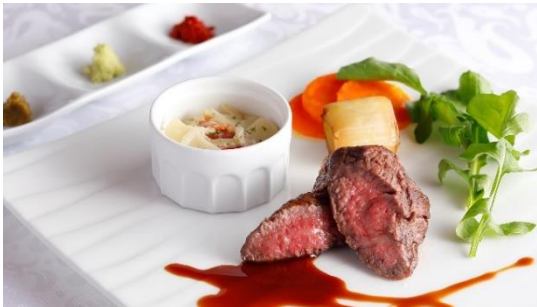
兵庫県産 特撰“神戸ビーフ”ランプ肉またはイチボ肉のステーキ 3種の薬味でどうぞ

柔らかな肉質で良質な脂肪酸を多く含み、口に入れた瞬間とけるような食感を味わえることが特長です。