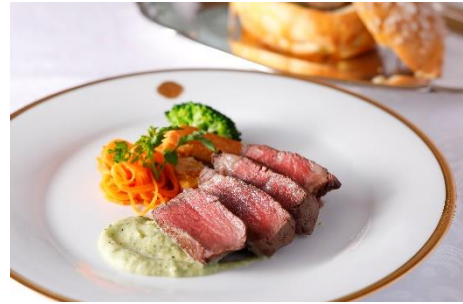
宮崎県産“宮崎牛”フィレ肉の岩塩包み焼き マデラソース

武州和牛特有の柔らかい鮮紅色の赤肉の中に、きめ細やかな風味たようサンが入った牛肉です。