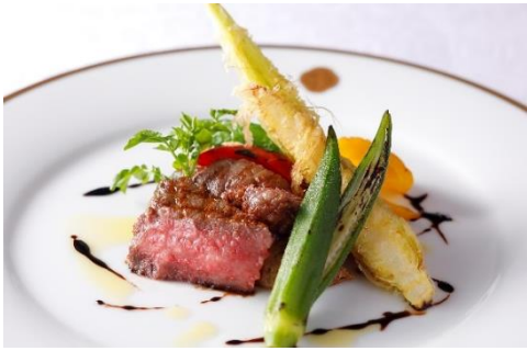
静岡県産 特撰和牛“静岡そだち”サーロインのグリル バルサミコソース