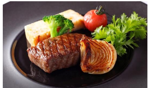
神奈川県産“葉山牛”サーロインまたはフィレ肉のグリル 爽やかなケツパーソースで

信州プレミアム牛は、香りの高さ・口だけの良さ・美味しさまでが認定です。ひと手間加えアッシュステーキにしました。