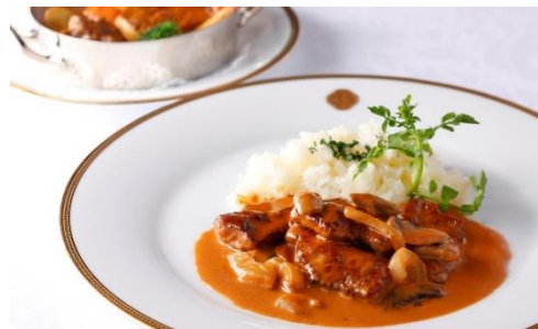
栃木県産“とちぎ和牛”フィレ肉のストロガノフ風

神戸ビーフの美味しさは肉の甘みと香りです。口だけの良い味わいは、いつまでも舌の上に存在感と甘さが尾を引く余韻の長さが特長です。