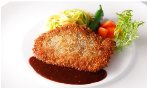
埼玉県産“武州和牛”ランプ肉またはイチボ肉のカツレット マスタードソース