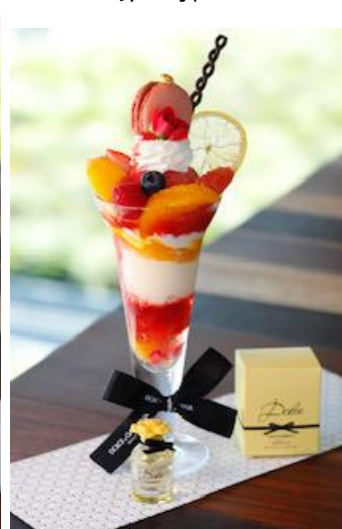
DOLCE & GABBANA BEAUTY