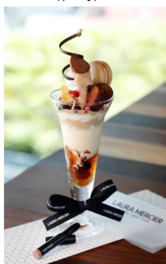
LAURA MERCIER PARIS | NEW YORK