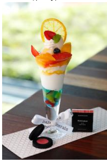
bareMinerals THE POWER OF GOOD