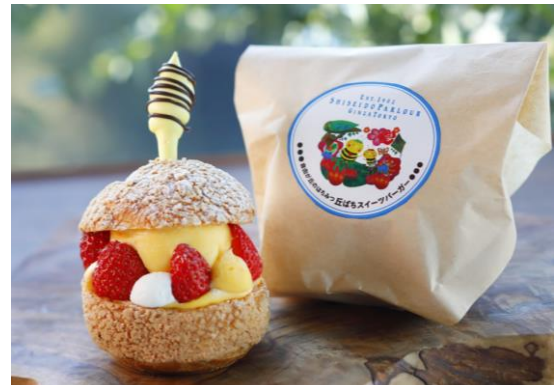
『丘ばちスイーツバーガー〈いちご〉』 660 円 ※テイクアウト 648 円 甘酸っぱいいちごとクリームは王道のマリアージュ。