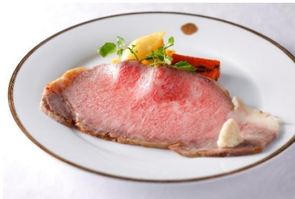
(“くまもとあか牛”サーロインのローストビーフ)