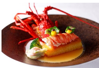
(千葉県産伊勢海老のポッシェ)